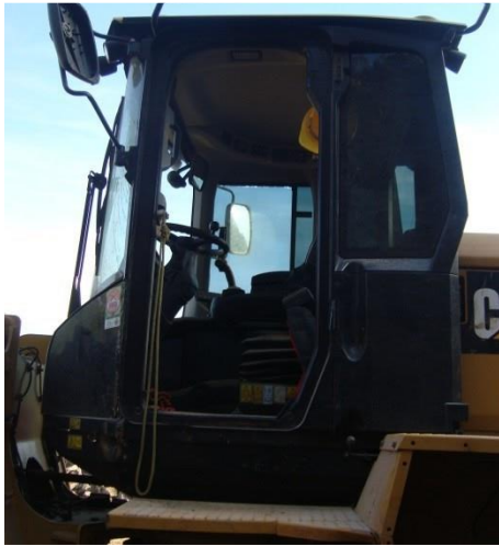
8.8. Foto 8